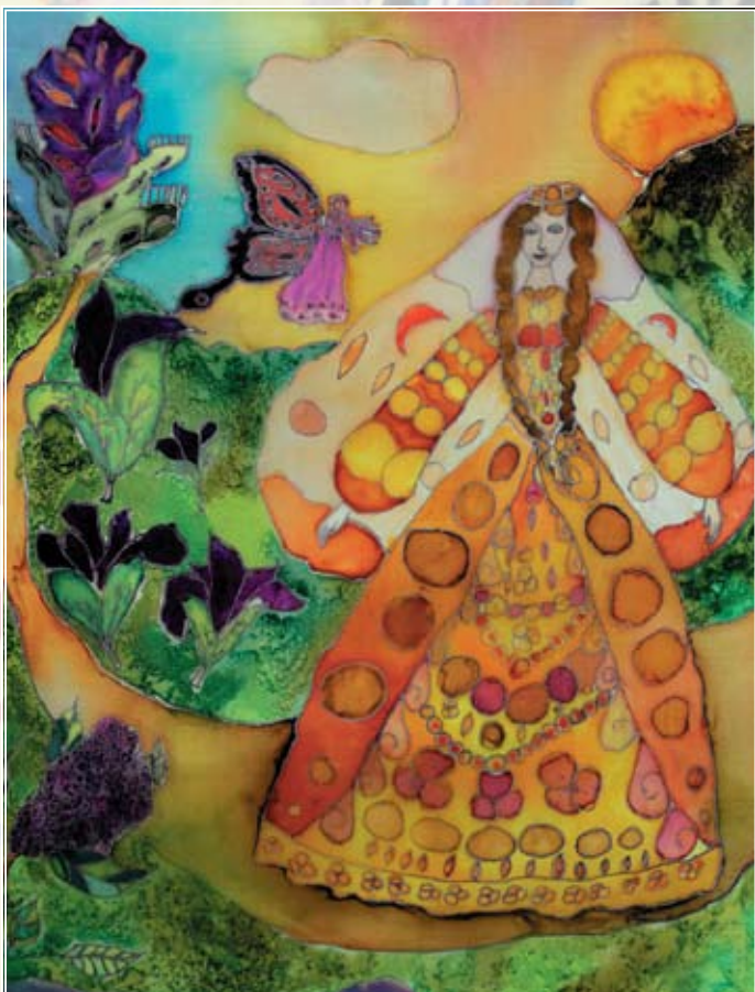
Сурконт Дина, 8 лет Подарок Феи Сирень (батик)