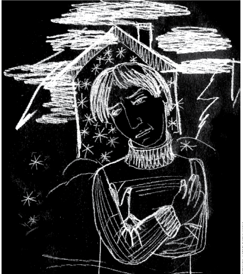
РИСУНОК: НАТАЛЬЯ КОНЬШИНА

Так что же заставляет подростков, находящихся отнюдь не в безвыходной ситуации, сводить счёты с жизнью? И как родители, учителя, общество могут предотвратить роковой шаг?