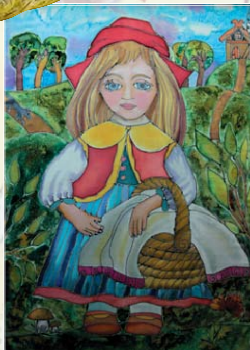
Афоница Вика, 8 лет Красная Шапочка (батик)