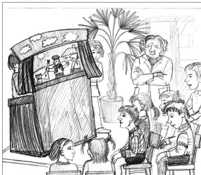
РИСУНКИ: НАТАЛЬЯ КОНЬШИНА

Н а первый взгляд, для волонтерства не требуется ничего, кроме энтузиазма, свободного времени и желания потратить его на добрые дела. На самом деле, одного благого порыва достаточно далеко не всегда: волонтер, отправляющийся в детский дом, должен иметь четкое представление о том, с чем он может столкнуться в учреждении и как ему следует себя вести в той или иной ситуации.