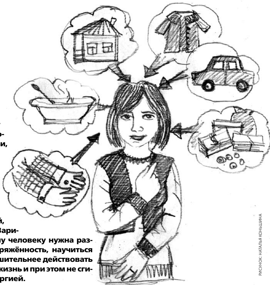
РИСУНОК: НАТАЛЬЯ КЮНЬШИНА

Л юди, оказавшиеся в трудной жизненной ситуации... Какие они разные! Один, сцепив зубы, будет делать всё, чтобы заработать достаточно средств для себя и семьи, выбраться из ямы — и ни за что не попросит помощи; другой замкнётся в себе и станет пытаться примириться с такой жизнью, считая её наказанием за что-то — а наказание надо терпеть; третий попытается любым способом избежать тех неприятных эмоций, которые испытывает, — и уйдёт в запой, игроманию или наркозависимость... Вариантов поведения множество. И каждому человеку нужна разная помощь: снижать внутреннюю напряжённость, научиться просить поддержки или наоборот — решительнее действовать самому, брать ответственность за свою жизнь и при этом не сгибаться под её грузом, а наполняться энергией.