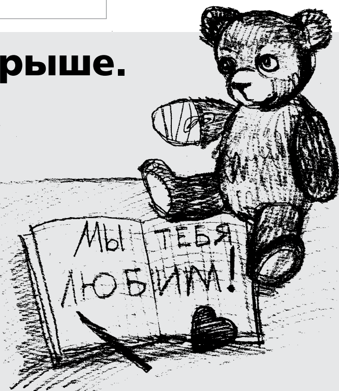
РИСУНОК: НАТАЛЬЯ КОНЬШИНА

...И вот я писала ей, что, знаешь, девочка моя, ты не поверишь, но ночь темнее перед рассветом. И когда ты живёшь дольше, чем 25 лет, то однажды начинаешь чувствовать это время. Час темноты и безысходности перед взлёт-