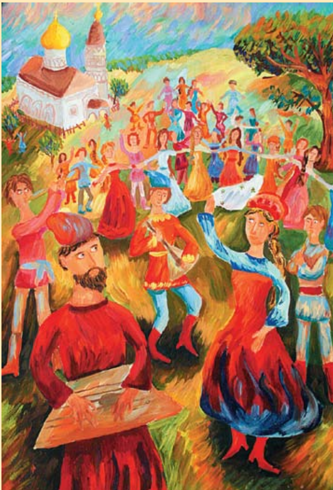
Шумейкина Рита, 14 лет (галерея «Изопарк») Русская музыка